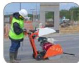
4X4 EXPLORER 350mm a CS451 (viz str. 96)