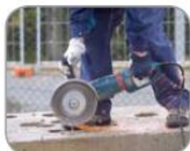
4X4 EXPLORER 230mm

Quickfix Více o Quickfix systému na str. 27.