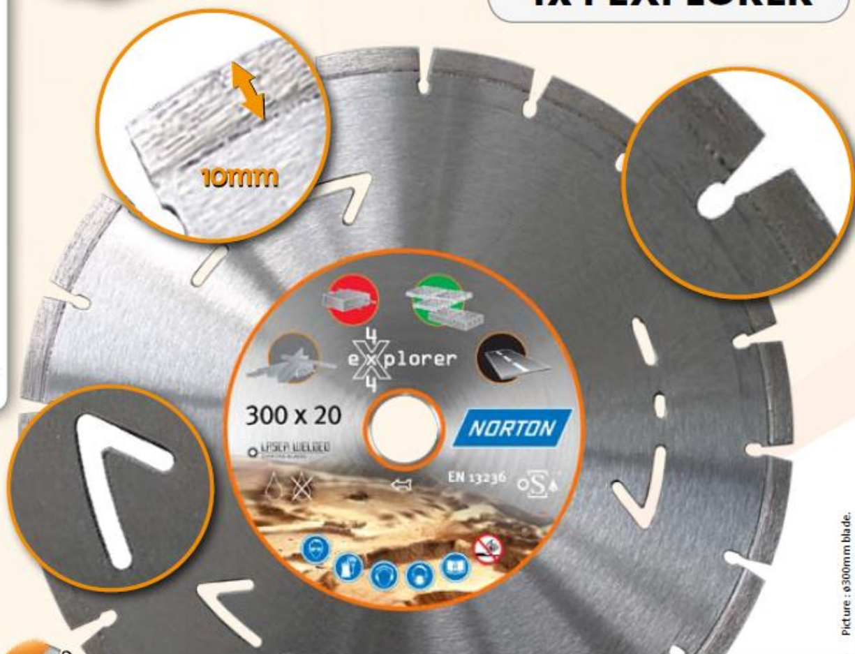
Picture : ø 300mm blade.