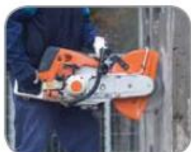
4X4 EXPLORER 300mm