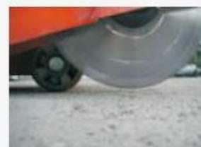
Ukazatel hloubky řezání